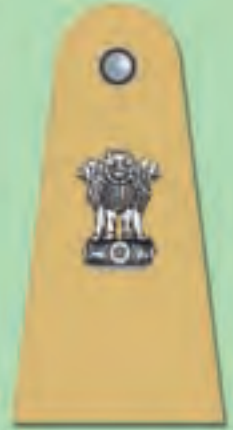
पुलिस अपर अधीक्षक (एड.एस.पी.)