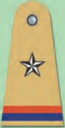
सहायक उप-निरीक्षक (ए.एस.आई.)