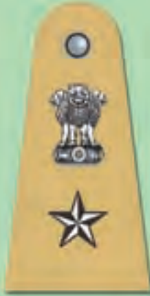
पुलिस अधीक्षक (एस.पी.)