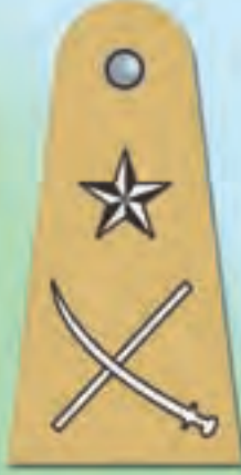
पुलिस महा निरीक्षक (आई.जी.पी.)