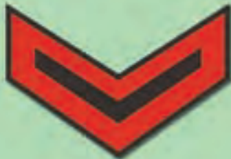
हेड कांस्टेबल (एच.सी.)