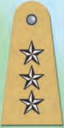
सहायक / उप पुलिस अधीक्षक (ए.एस.पी. / डी.एस.पी.)