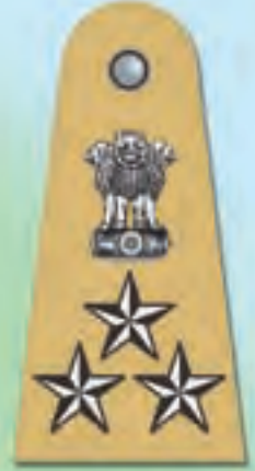
पुलिस उप-महानिरीक्षक (डी.आई.जी.)