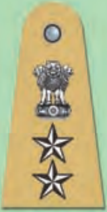
वरिष्ठ पुलिस अधीक्षक (एस.एस.पी.)