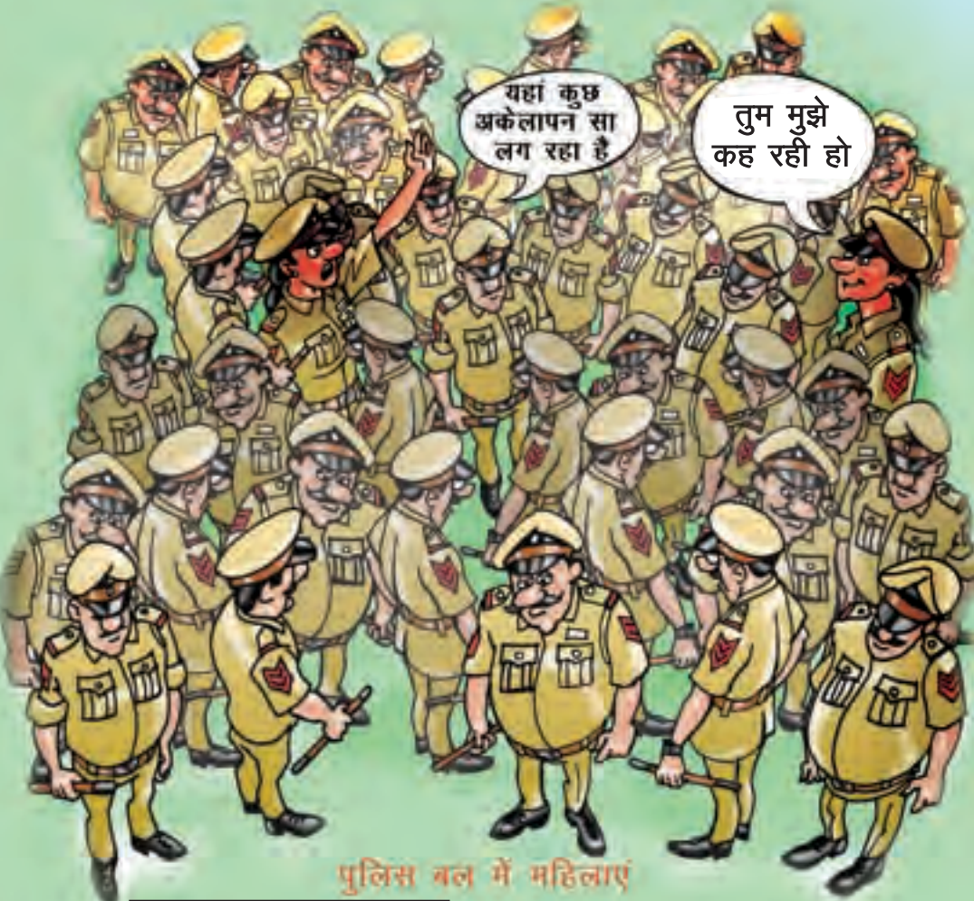
पुलिस बल में महिलाएं

हाँ, पुलिस में विभिन्न समुदायों के प्रतिनिधित्व में सुधार करने के लिए विशेष कोटों द्वारा सहायता उपलब्ध है। अनुसूचित जाति, अनुसूचित जनजाति और अन्य पिछड़े वर्गों को