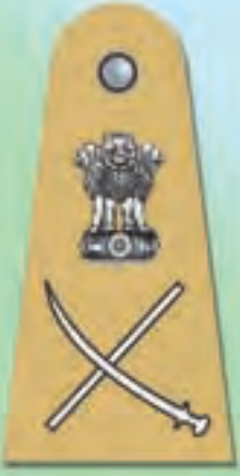
पुलिस महानिदेशक (डी.जी.पी.)